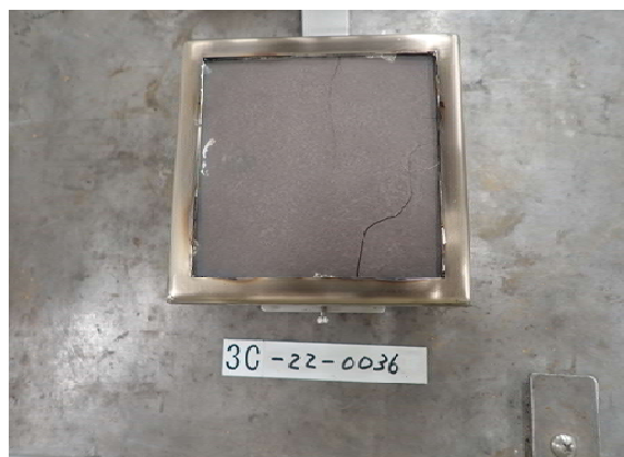
写真-2 試験体A 試験後